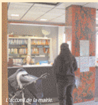
L'accueil de la mairie.

L'accessibilité des services publics à tous est un objectif de la commune. En mairie, une nouvelle rampe d'accès et une porte d'entrée plus maniable seront aménagées. Des modifications seront réalisées à la piscine pour accueillir les personnes à mobilité réduite avec réalisation d'un accès définitif ; la mise en conformité et la modernisation des installations (chaufferie, filtrage...) se poursuivent. À l'étude depuis quelques années, le projet d'agrandissement et d'aménagement de la hallegarderie et du relais d'assistantes maternelles aboutira en 2007. Deux appartements de fonction de Villard-Benoît seront transformés en locaux d'activités extra-scolaires. Les locaux des Galopins