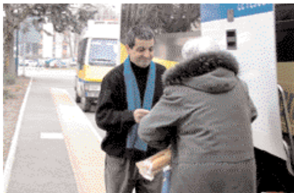
Le transport pour aller au marché.

49 communes ont signé en 2005 la Charte du Pays du Grésivaudan avec la volonté de répondre ensemble aux défis d'organisation moderne sur leur territoire : zones d'activités, transports, logements, emploi, environnement... Le SMPG n'a pas de compétence propre mais il peut contractualiser avec la Région, le Département et l'État. L'un des premiers projets, qui a suscité de nombreuses réunions et concertations, est la création d'une AOTU (Autorité Organisatrice des Transports Urbains) pour réfléchir aux transports des 90.000 habitants du Grésivaudan et les organiser localement en cohérence avec les lignes existantes du département et de la région. Depuis septembre dernier, les communes sont appelées à délibérer pour ou contre la création de l'AOTU sur la base du réseau retenu après concertation. La Communauté de Communes du Haut-Grésivaudan est associée à la démarche.